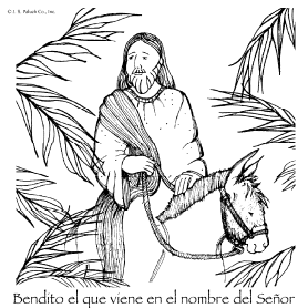
Bendito el que viene en el nombre del Señor

Domingo de Ramos, Año C, © Copyright, JS Paluch Co.